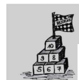
Staatliche Regelschule „Bürgerschule“ Sonneberg

„Gefördert durch den Freistaat Thüringen aus Mitteln des Europäischen Sozialfonds