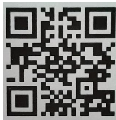
Abbildung QR-Code des BTM e.V.

Bitte wenden Sie sich an Ihre Vermittlerin oder Ihren Vermittler!